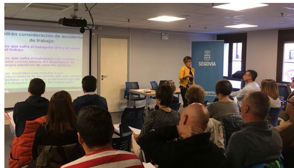
Jornada en Segovia