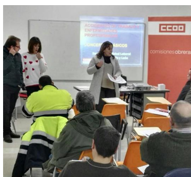
Jornada en Ágreda (Soria)