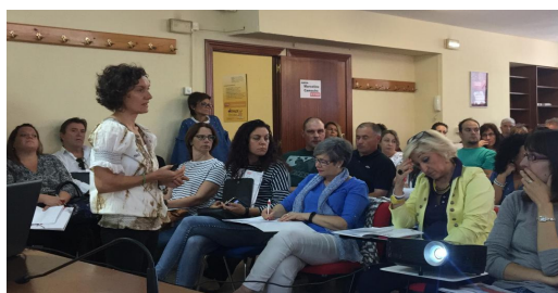
Jornada en Palencia