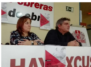
Jornada en Miranda (Burgos)