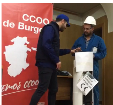
Jornada en Burgos