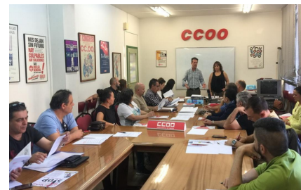
Jornada en Zamora

A lo largo de este año la Secretaría de Salud Laboral ha llevado a cabo varias jornadas formativas dirigidas a delegados y delegadas de prevención, pero en las que también han tenido cabida todos aquellos representantes o cargos sindicales con especial interés en temas de prevención de riesgos. Es de resaltar el gran éxito y acogida que han tenido las jornadas llevadas en todas y cada una de las provincias de la Región ( entre los meses de octubre y diciembre ) y en las que se ha hecho una gran labor de concienciación para llevar a cabo una buena gestión de los accidentes de trabajo y enfermedades profesionales una vez acaecidos, con el fin de que no se vuelvan a producir.