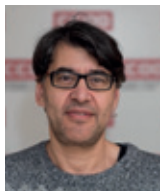
Gonzalo Díez Piñeles, secretario general de Industria: "Refuerzo de la industria y desmantela- miento de la minería"

La industria en 2015 ha tenido un incipiente crecimiento en metal, bienes de equipo, automoción y química, merced al tirón de las ventas en el exterior. Por el contrario ha habido un estancamiento en textil, renovables, minería no energética, salvo casos aislados, y el desmantelamiento de la minería del carbón provocado por la nefasta política del Gobierno del PP.