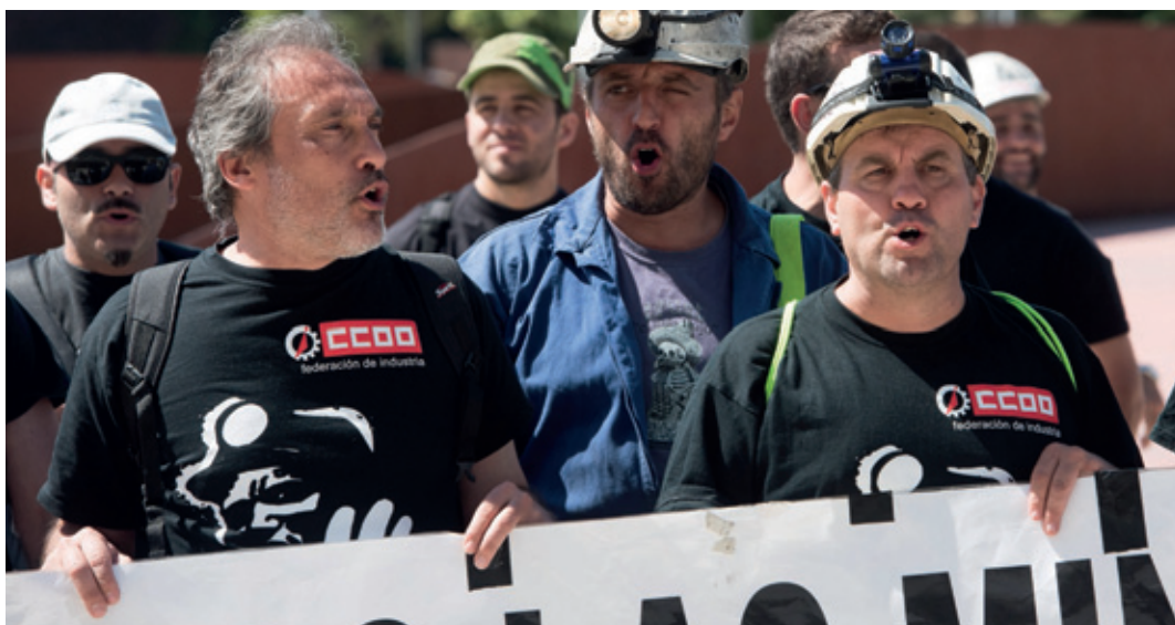
“Las protestas de los mineros han sido constantes ante la falta de solución al problema de las cuencas”.

Además, la Mesa del Carbón estudiará medidas para revitalizar económicamente las zonas mineras y exigirá fondos para investigar cómo