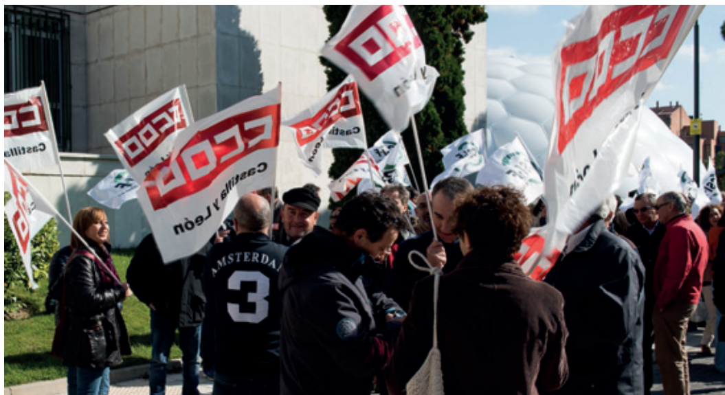
Las trabajadoras y trabajadores de las Administraciones Públicas han mantenido movilizaciones para la recuperación de sus condiciones laborales.

Es de justicia, ahora que se proclaman cifras macroeconómicas positivas, que las empleadas y empleados públicos recuperen sus antiguas condiciones de empleo y retribución.