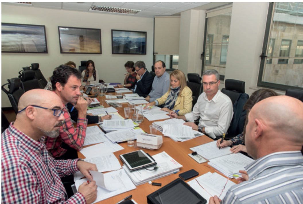
Reunión de la Mesa del Diálogo Social sobre prevención de riesgos laborales.

Logramos 700 millones para empleo entre 2016 y 2020, 140 en este año 2016.