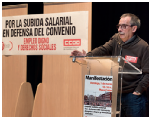
El secretario confederal de Acción Sindical, Ramón Górriz, participó en algunas de las Asambleas celebradas durante la campaña por la subida de los salarios.

Tras la campaña sindical por la recuperación salarial, la patronal aceptó recomendar incrementos salariales por encima del 1,5% en Castilla y León.