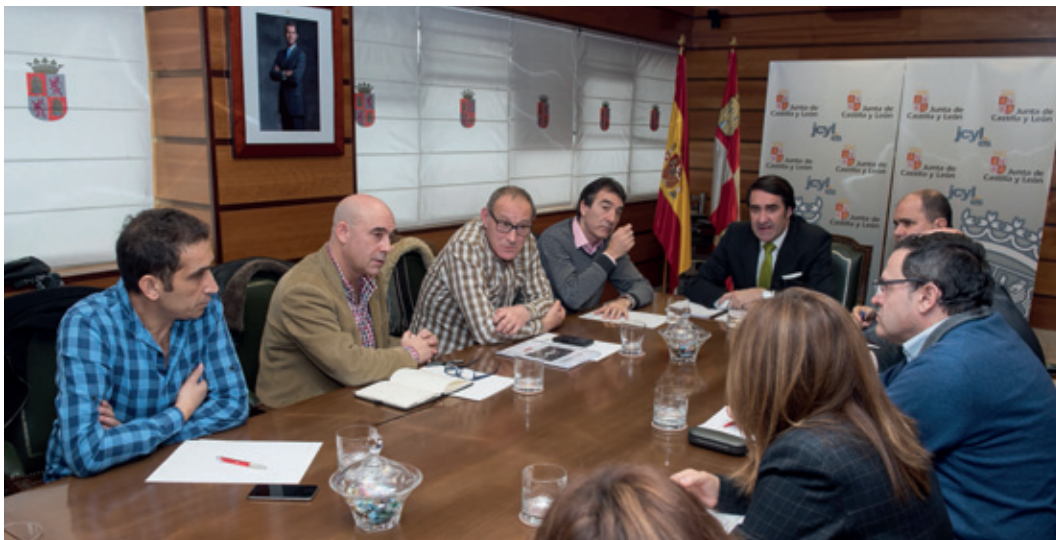
“Los alcaldes y alcaldesas de las localidades por las que pasa la línea de cercanías acompañaron a los representantes de CCOO en la visita al Consejero de Fomento de la Junta de Castilla y León”.

Contamos con el respaldo de todos los Ayuntamientos de la línea, de todos los Grupos Parlamentarios y de la Junta.