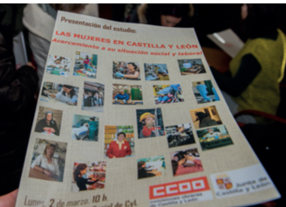
El estudio sobre las mujeres de Castilla y León se presentó en una jornada en el mes de marzo.

LAS MUJERES SUFREN DISCRIMINACIÓN SALARIAL desde el mismo instante de entrar al empleo. Esta es una de las conclusiones más importantes del Estudio sobre la situación social y laboral de las Mujeres en Castilla y León, elaborado por la Secretaría de la Mujer de CCOO Castilla y León. Pero el Estudio resalta que la brecha se agranda a lo largo de la vida laboral porque las mujeres sufren con más