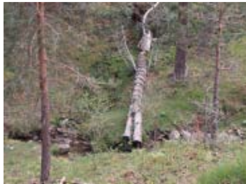
El paisaje por el que discurrió la marcha configura un entorno de ensueño.