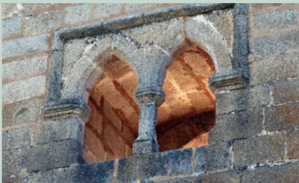
Foto 2: ¿En qué rincón de Burgos o su provincia está tomada esta imagen?