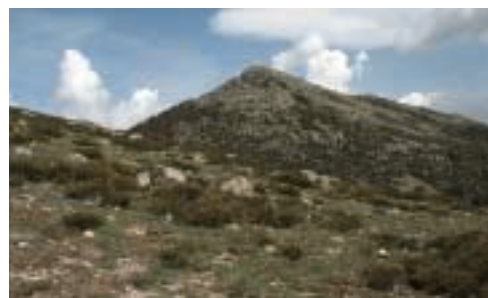
El perfil de 'La Mujer Muerta' se aprecia con nitidez desde la parte inferior de su collado.