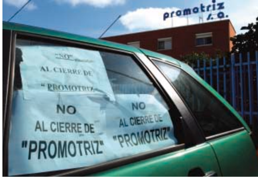
Las trabajadoras de Promotriz demandan la solidaridad de los ciudadanos.