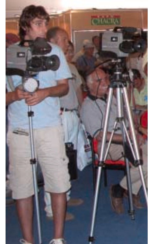
La situación laboral de los periodistas españoles sigue siendo preocupante.

Sobre el 33% de los informadores se encuentra en situación de precariedad laboral y, por todo ello, la V Convención insta a las organizaciones que integran el FOP a impulsar en el ámbito de la negociación colectiva las cláusulas necesarias para frenar este proceso de precariedad laboral.