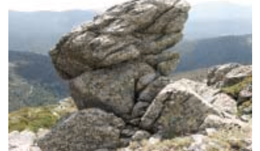
Las piedras, presentes a lo largo de toda la ruta, forman unas imágenes muy atractivas.