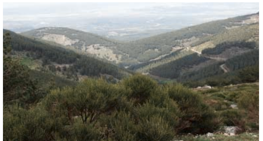
Vista panorámica de la zona segoviana desde una de las cumbres.

este asunto y se pueda crear el ansiado parque natural de la Sierra de Guadarrama.