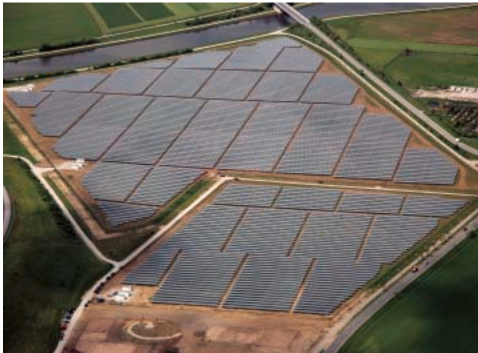
Las plantas fotovoltaicas tienen futuro desde el punto de vista de generación energética.

Es la leonesa una provincia vinculada a la producción energética más clásica, es decir, la derivada del carbón y la hidroeléctrica, cuyas principales expresiones han sido las cuencas mineras de Laciana y El Bierzo, las térmicas de La Robla, Compostilla y Anllares y los diversos aprovechamientos hídricos en los embalses. En paralelo a la reconversión del carbón, durante los últimos años se ha desarrollado también un importante segmento relacionado con la energía eólica, desde la producción de componentes en empresas como LM, Comonor y Vestas, hasta la instalación de numerosos parques eólicos; y a la par comienzan a insinuarse algunos proyectos en el entorno de las bioenergías, con plantas pre-