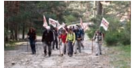
Los compañeros y compañeras de CC.OO. en los primeros compases de la marcha con las banderas perfectamente desplegadas.