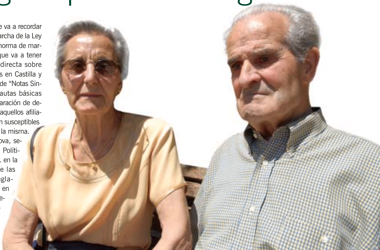
Los ancianos son los grandes beneficiados de una Ley que busca solventar un problema enquistado en el tiempo. Víctor Otero