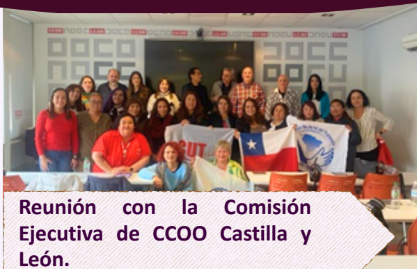
Reunión con la Comisión Ejecutiva de CCOO Castilla y León.