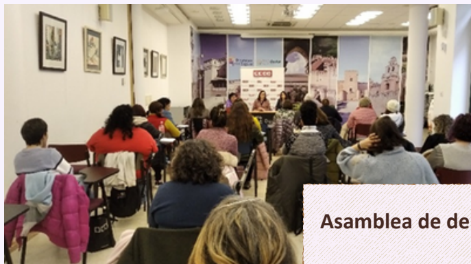
Asamblea de delegadas 8M