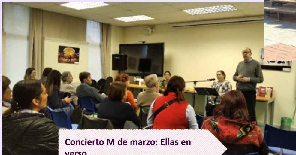
Concierto M de marzo: Ellas en verso.