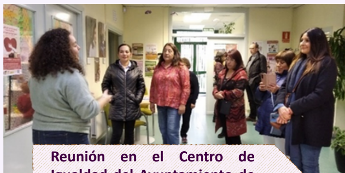
Reunión en el Centro de Igualdad del Ayuntamiento de Valladolid.