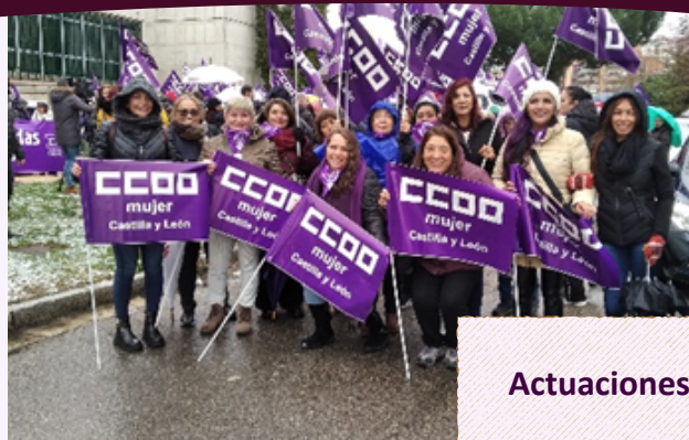
Actuaciones sindicales 8M