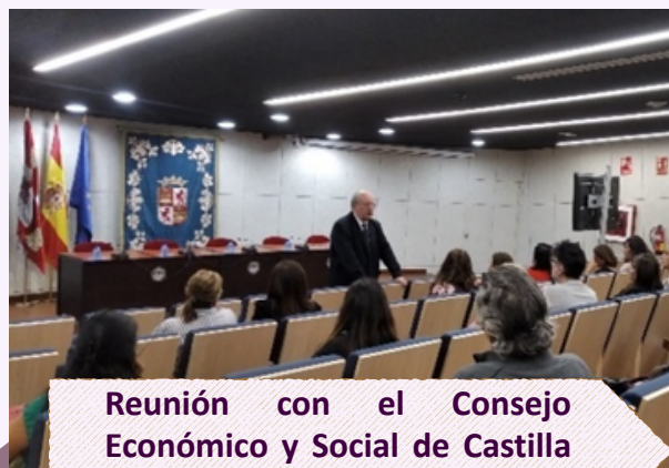
Reunión con el Consejo Económico y Social de Castilla y León.