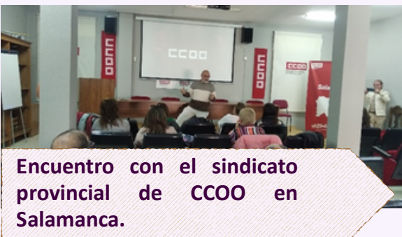
Encuentro con el sindicato provincial de CCOO en Salamanca.