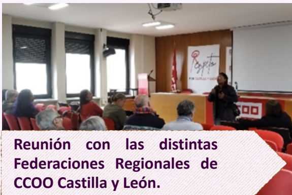
Reunión con las distintas Federaciones Regionales de CCOO Castilla y León.