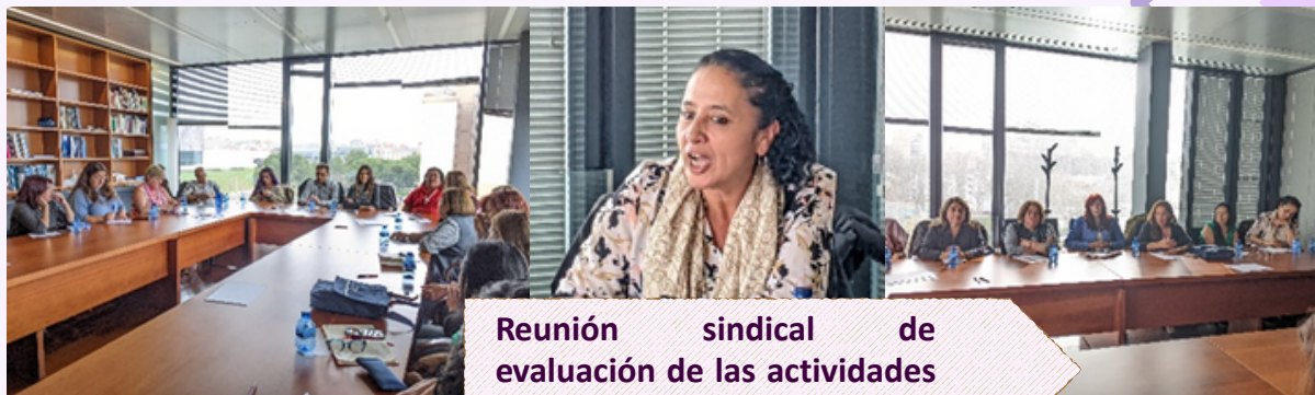
Reunión sindical de evaluación de las actividades del Programa.