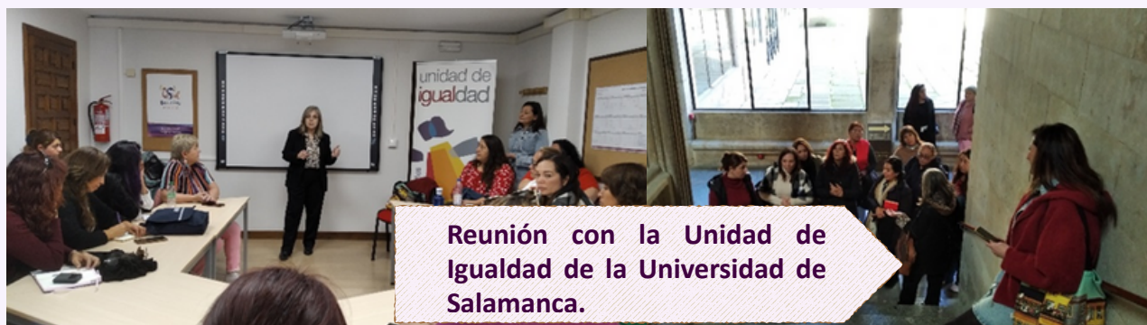
Reunión con la Unidad de Igualdad de la Universidad de Salamanca.