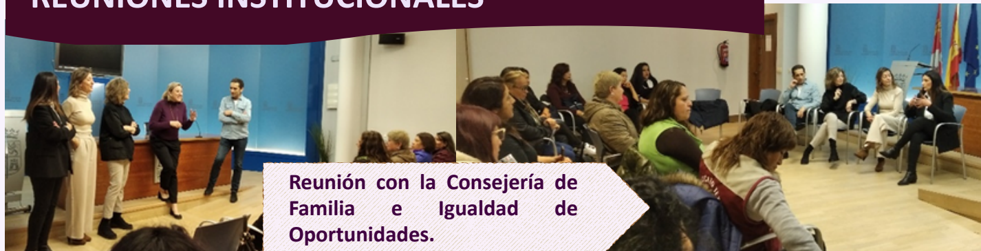
Reunión con la Consejería de Familia e Igualdad de Oportunidades.