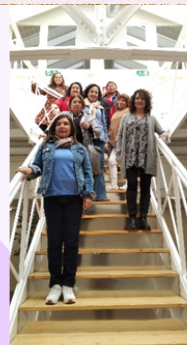
Reunión con la Fundación de Formación y Orientación de Castilla y León (FOREMCYL).