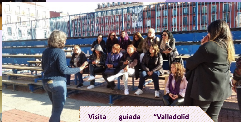
Visita guiada “Valladolid Feminista”.