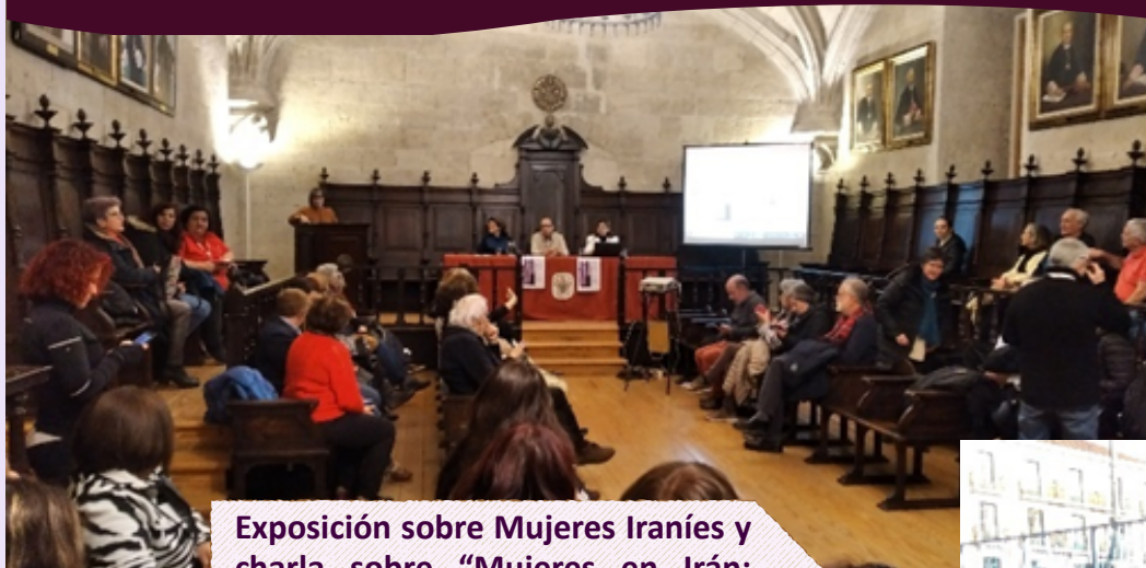
Exposición sobre Mujeres Iraníes y charla sobre “Mujeres en Irán: leyes y resistencias”.